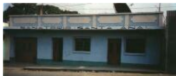
Ospedale pediatrico "Sanatorio Santa Ana"

abbiamo realizzato uno molto piccolo solo con l'essenziale per provvedere alle maggiori esigenze del posto. Siamo certi che porterà ottimi benefici.